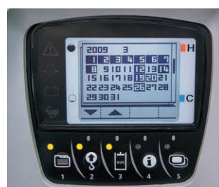
Protokoll der Betriebshistorie