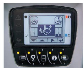
Einstellung max. Hydraulikölmenge